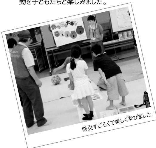
防災すごろくで楽しく学びました

今後も様々な立場の方が楽しく参加できる講座を開催し、ボランティア活動の裾野を広げていきます。