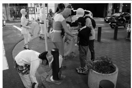
戦隊スーツを着て、親子と一緒にゴミ拾いをするインターン生

8月18日（日）には「ア∞ス戦隊！ゴミ拾いレンジャーとゴミ拾いしよう」をNGOア∞スのご協力で行いました。戦隊スーツを着た地球の環境を守るア∞ス戦隊と一緒に親子で作成した変身ベルトを装着し、矢場公園周辺でゴミ拾いをしました。気温が高い日でしたが、大人も戦隊スーツを着て、ゴミ拾い活動を子どもたちと楽しみました。